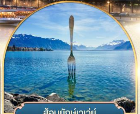
ส้อมยักเข่าเว้ย