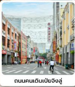
ถนนคนเดินเป่ย์จิงลู่