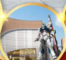
กันดั้ม ปาร์ค ฟุคุโอกะ