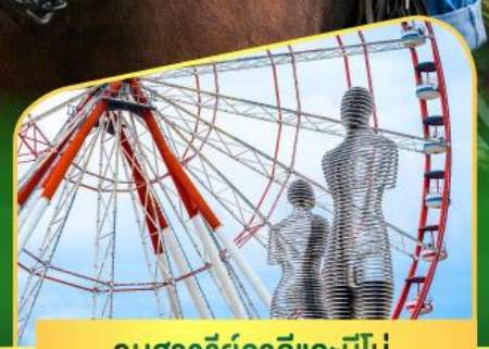
อนุสาวรีย์อาลีและนีโน่