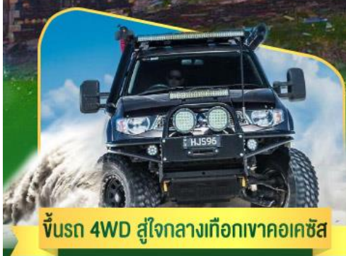
คันรถ 4WD สู้อีกกลางเทือกเขาคอเคซัส