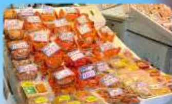
ตลาดปลาโจโก