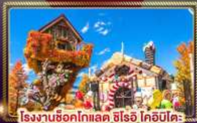
โรงงานช็อคโกแลต ชิโรอิ โคอิบิโคะ