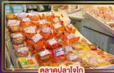
ตลาดปลาโจก