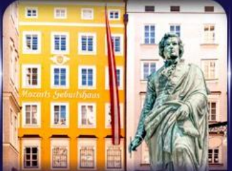
บ้านเกิดโมสาร์ท ซาลซ์บูร์ก