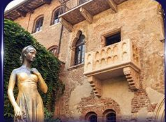
เขื่อนบ้านจูลีเยต เวโรนา