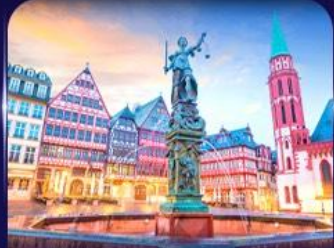
จัตุรัสโรมเวอร์ แพรงก์เฟิร์ต