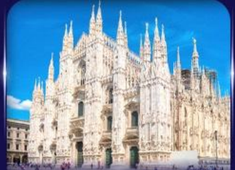
เซ็คฉันวิหารดูจโม่ มิลาโน