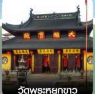
วัดพระศยกขาว