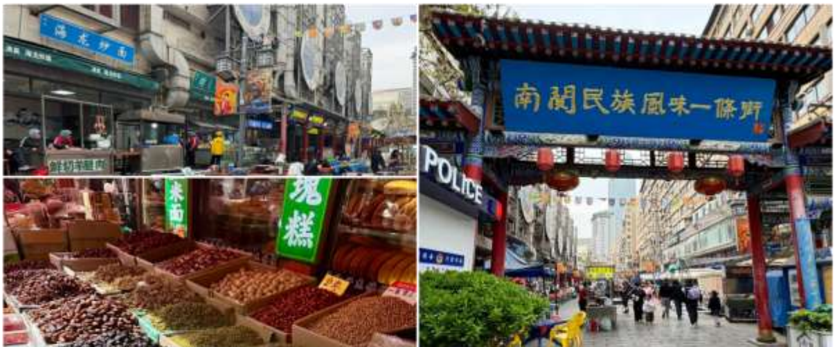
ถนนคนเดินเซี่ยหนานกวน

สมควรแก่เวลานำทุกท่านเดินทางสู่สนามบิน เพื่อทำการเช็คอินกับสายการบิน