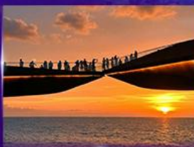
สะพานจูบ Sunset Town