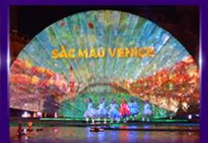
Sac Mau Venice Show