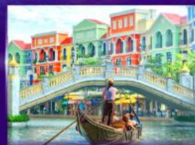
เวนิสจำลอง แกรนด์ เวิลด์