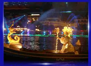
ชมโชว์เวนิสจำลอง แกรนด์วิลด์