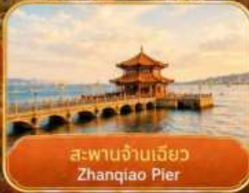
สะพานจันเจียว Zhanqiao Pier