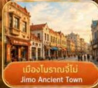
เมืองโบราณจี้โม Jimo Ancient Town