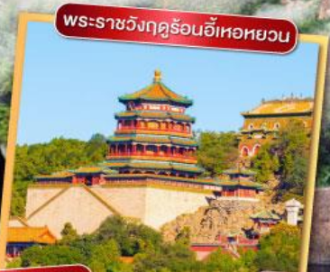
พระราชวังฤดูร้อนอี้เหอหยวน