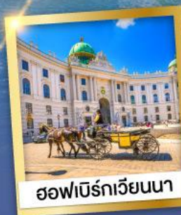
ออสเตรียเวียนนา

เข้าชมความงดงามภายใน ของปราสาทนอยชวานสไตน์