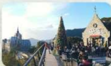
Gio Cafe Tam Dao