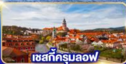
เชสกีครุมลอฟ