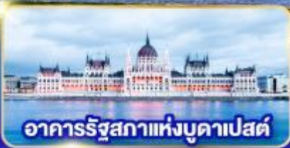
อาคารรัฐสภาแห่งบูดาเปสต์