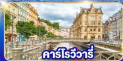
คาร์โรวัวร์