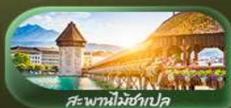
ทะเลสาบลูเซิร์น

เดินทาง 02-10 เม.ย. 69 / 04-12 เม.ย. 69 24 เม.ย.-02 พ.ค. 69 29 เม.ย.-07 พ.ค. 69 / 29 พ.ค.-06 มิ.ย. 69