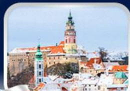
เมืองเชสกี ลุมลอฟ