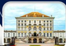
พระราชวังนิมเฟนบวร์ก