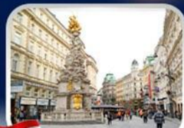
ซ็อบบิงการ์ทเนอร์สตรีก