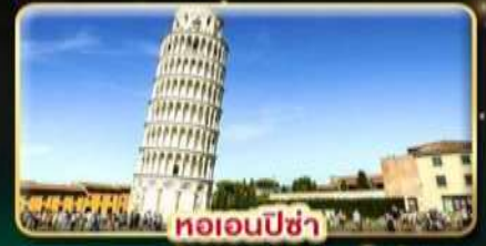
หออนปีซ่า