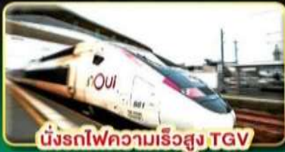
นั่งรถไฟความเร็วสูง TGV