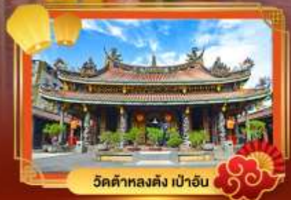
วัดต้าหลงตั้ง เป่าอัน